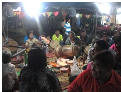
(ภาพซ้าย) พื้นที่ศาลาแปดเหลี่ยมช่วงที่โต๊ะหมอบทำพิธี (ภาพขวา) การเล่นรำมะนาในช่วงงานพิธีลอยเรือ

ศาลาพื้นทรงแปดเหลี่ยมซึ่งตั้งอยู่บริเวณหน้าหาดช่วงปากทางเข้าศาลเจ้า โต๊ะบาทลิว เป็นจุดศูนย์กลางของหมู่บ้านเพื่อใช้ในการประกอบพิธีกรรม หรืองานแสดงต่างๆ รวมทั้งเพื่อรองรับการฝึกซ้อมและแสดงรองแจ้ง ชาวเลจึงเรียก ศาลานี้ว่า “ศาลารองแจ้ง” ในช่วงที่ไม่มีกิจกรรมใดๆ ศาลาแปดเหลี่ยมนี้ก็จะเป็นที่ นั่งพักผ่อนพูดคุยของชาวเลหญิงชาย และเด็กๆ ก็จะวิ่งเล่นกันอยู่ริมหน้าศาลา