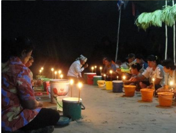
(ภาพบน) ชาวเล رأىร่ารอบเรือป้อลาจ๊กที่ตั้งไว้ทำพิธี