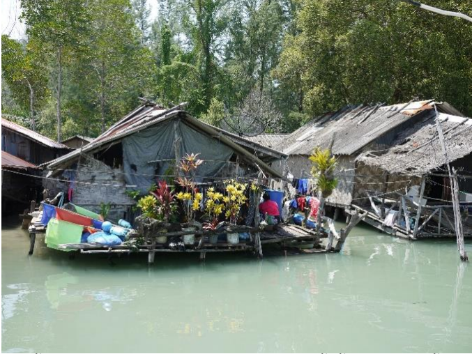
ช่วงน้ำลงก็เดินไปมาหาสู่กันได้สะดวก ส่วนช่วงน้ำขึ้นสูงเกือบถึงพื้นบ้าน