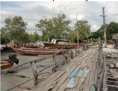
สะพานเดิมโครงสร้างเป็นไม้พังทลายไม่กระดาน