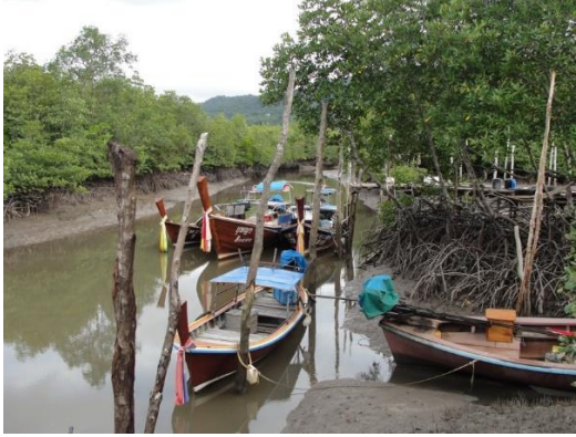
บรรยากาศบริเวณปากคลองซอยในแนวป่าชายเลนที่ไหลออกสู่ทะเลด้านนอก

เราได้เห็นหอย่อมป่าชายเลนด้านหน้าหมู่บ้าน ตรงเส้นทางเดินสู่ชุมชนแล้ว เมื่อเราเดินเข้ามาด้านในสุดของหมู่บ้าน เราจะเห็นทางเดินที่สร้างเป็นสะพานไม้กว้างประมาณหนึ่งเมตร เดินเข้ามาสักนิด เราจะพบกับคลองที่มีเรือหัวโทงหลายลำจอดอยู่ มีการสร้างสะพานยื่นเป็นท่าเรือเล็กๆ สองจุดให้ชาวเลสามารถใช้ได้สะดวกไม่ต้องแออัดในจุดขึ้น-ลงเดียว คลองที่เห็นนี้คือคลองซอยในแนวป่าชายเลนที่แยกมาคลองลัดบ่อแทนที่เห็นเป็นผืนทะเลหน้าชุมชน ชาวอูร์รักลาไวย์จะนำเรือเข้ามาจอดในคลองนี้ เพื่อหลบลมมรสุม