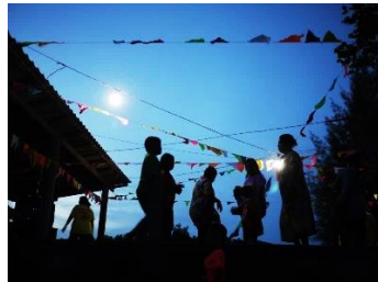
การใช้พื้นที่ศาลาอเนกประสงค์ในช่วงงานพิธีลอยเรือ