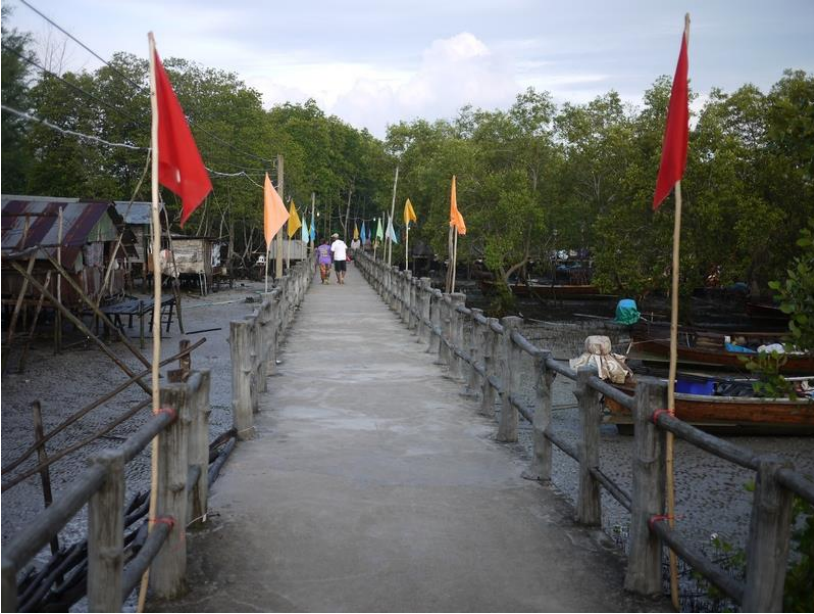
บรรยากาศบริเวณสะพานปูนที่ทอดยาวผ่านป่าชายเลนเข้าสู่ชุมชนโต๊ะบาหลิว

ชุมชนโต๊ะบาหลิว อยู่ในพื้นที่หมู่ 1 ตำบลศาลาด่าน อำเภอเกาะลันตา จังหวัดกระบี่ ลักษณะทางกายภาพของชุมชนนั้นตั้งอยู่บริเวณชายฝั่งทะเลด้านทิศเหนือของเกาะลันตาใหญ่ ซึ่งอยู่ไม่ไกลจากท่าเรือแพขนานยนต์ที่เดินทางข้ามจากเกาะลันตาน้อยมายังเกาะลันตาใหญ่ ชาวเลบ้านโต๊ะบาหลิวมีจำนวนประมาณ 50 หลังคาเรือน มีประชากรชาวเลจำนวน 156 คน 1 ส่วนใหญ่ประกอบอาชีพประมงพื้นบ้าน วางอวน และใช้ลอบขนาดเล็กตกปลาและสัตว์ทะเลอื่นๆ