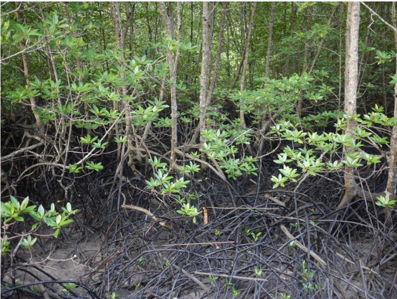
ป่าชายเลนเป็นแหล่งอนุบาลสัตว์น้ำที่สำคัญ ไม่ว่าจะเป็นกุ้ง หอย ปู ปลา

ชาวอูรักลาไวย์มีความรู้ความชำนาญเกี่ยวกับพื้นที่ชายฝั่งทะเล ไม่ว่าจะเป็นชายหาด แนวปะการัง ไซตหิน ป่าชายเลน ฯลฯ ที่เหล่านี้ล้วนเป็นแหล่งทำกิน ที่อยู่อาศัย และบางแห่งเป็นพื้นที่ศักดิ์สิทธิ์และจิตวิญญาณด้วย นอกจากนั้น ชาวอูรักลาไวย์ยังมีความรู้เกี่ยวกับพืชพันธุ์ไม้ในป่า เพราะว่าเป็นในสมัยก่อน ไม้ที่ทำเรือและบ้านก็ได้มาจากป่าบนเกาะนี้เอง ป่ายังเป็นแหล่งอาหารจำพวกพืชผัก และเป็นแหล่งยาสมุนไพร แต่ในช่วงหลังเมื่อพื้นที่เหล่านี้ก็กลายเป็นกรรมสิทธิ์ของเอกชนหรือเป็นพื้นที่อนุรักษ์ ชาวอูรักลาไวย์ก็ไม่สามารถจะเข้าไปใช้ประโยชน์จากป่าได้อีก