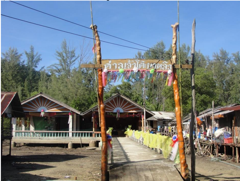
ซุ้มป้ายทางเข้าสู่ศาลเจ้าโต๊ะบาหลี ด้านขวามือเป็นส่วนเรือนแถวรับรองญาติพี่น้องช่วงพิธีลอยเรือ