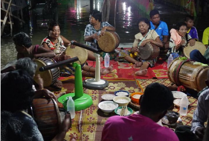
วงรำมะนาเป็นองค์ประกอบสำคัญของพิธีลอยเรือ

นอกจากนั้น หากบ้านไหนมีคนเจ็บป่วยไข้ ไม่สบาย แล้วมีการบนต่อสิ่งศักดิ์สิทธิ์ก็จะมาเชิญโต๊ะหมอไปประกอบพิธี และยังมีพิธีกรรมอื่นๆ ที่จะมีโต๊ะหมอเป็นผู้นำประกอบพิธีกรรม