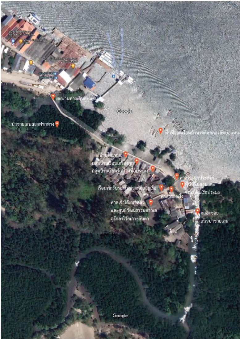
ภาพถ่ายทางอากาศของชุมชนชาวอูว์กาลาไวยไต่ะบาหลิว