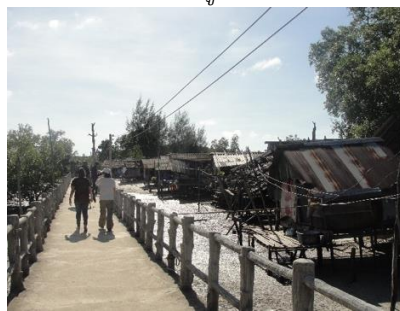
ส่วนภาพขวาเป็นสะพานปูนในปัจจุบัน