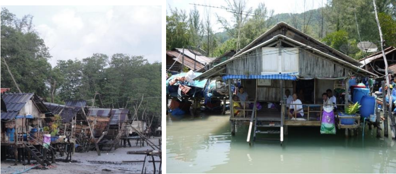
สภาพบ้านชุมชนโตะบาทลิว (ซ้าย) ในช่วงน้ำลงและ (ขวา) ช่วงน้ำขึ้น

โครงสร้างและวัสดุในการสร้างบ้านของชาวอุรักลาไวย์นั้นก็เลือกใช้เพียงวัสดุธรรมชาติที่สามารถหาได้ง่ายในท้องถิ่น เช่น ไม้ฟังกา ฝาสานขัดแตะ ตัวบ้านมีชานยื่นออกมาเล็กน้อยเพื่อประโยชน์ใช้สอย เช่น เป็นพื้นที่นั่งเล่นพักผ่อนหย่อนใจ เป็นพื้นที่กินอาหาร ส่วนนอกชานก็ขึงราวตากผ้า ปลูกต้นไม้ประดับสวยงาม