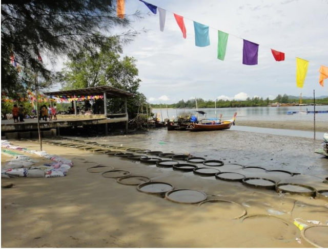
ศาลาอเนกประสงค์ที่ใช้เป็นเวทีร่ายรำและการแสดงของชุมชนในช่วงพิธีลอยเรือ

พื้นที่สาธารณะเป็นส่วนสำคัญของชุมชนชาวเลทุกแห่ง เพราะแต่ละชุมชนจะมีงานประเพณีหรือพิธีกรรมที่ชาวเลเข้าร่วมอย่างพร้อมเพรียง แม้ว่าชุมชนโต๊ะบาหลิวจะมีพื้นที่ไม่กว้างนัก แต่ก็มีบริเวณที่ชาวบ้านมาใช้ร่วมกันและร่วมกันดูแลอยู่หลายแห่ง