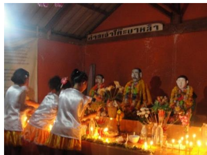
ภาพภายในศาลเจ้าโต๊ะบาหลีและบรรยากาศที่เด็กๆ ชาวอุรักลาไวย์มาเช่นไหว้ เพื่อขอกำลังใจก่อนขึ้นแสดงบนเวทีในช่วงงานพิธีลอยเรือ