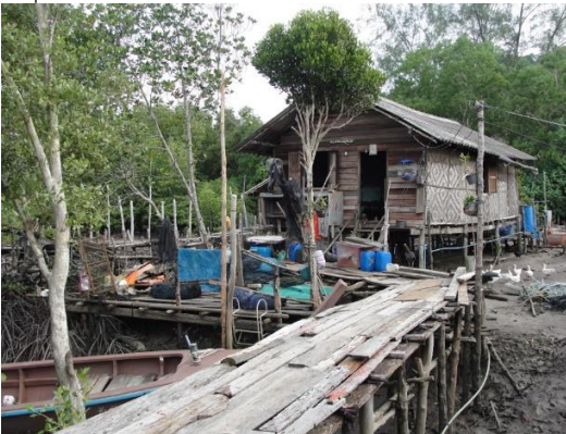
บริเวณนี้มีบ้านหลังเล็กๆ ของชาวเลสร้างด้วยฟาสานขัดแตะและไม้กระดาน แทรกตัวอย่างกลมกลืนอยู่กับผืนป่าชายเลน

เราได้เห็นหอย่อมป่าชายเลนด้านหน้าหมู่บ้าน ตรงเส้นทางเดินสู่ชุมชนแล้ว เมื่อเราเดินเข้ามาด้านในสุดของหมู่บ้าน เราจะเห็นทางเดินที่สร้างเป็นสะพานไม้กว้างประมาณหนึ่งเมตร เดินเข้ามาสักนิด เราจะพบกับคลองที่มีเรือหัวโทงหลายลำจอดอยู่ มีการสร้างสะพานยื่นเป็นท่าเรือเล็กๆ สองจุดให้ชาวเลสามารถใช้ได้สะดวกไม่ต้องแออัดในจุดขึ้น-ลงเดียว คลองที่เห็นนี้คือคลองซอยในแนวป่าชายเลนที่แยกมาคลองลัดบ่อแทนที่เห็นเป็นผืนทะเลหน้าชุมชน ชาวอูร์รักลาไวย์จะนำเรือเข้ามาจอดในคลองนี้ เพื่อหลบลมมรสุม