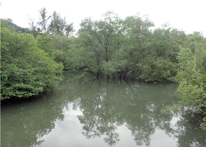
ผืนป่าชายเลนสองข้างทางก่อนเข้าสู่ชุมชนโต๊ะบาหลิว