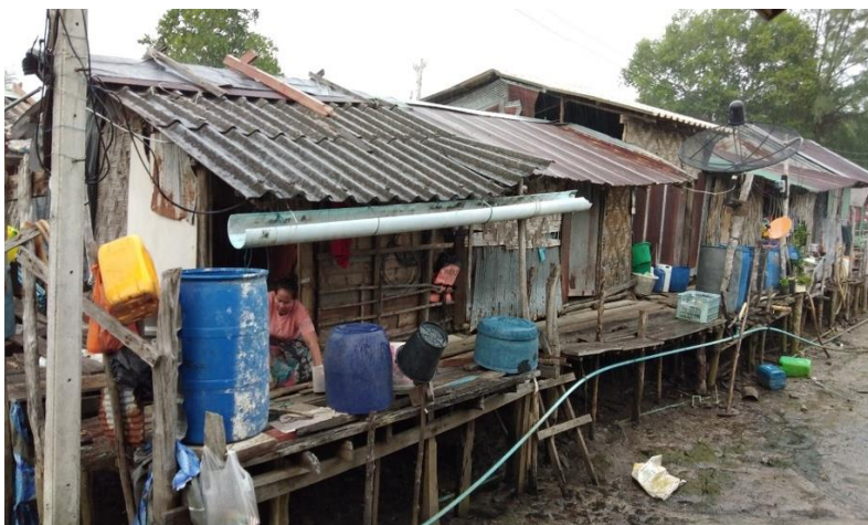
(ภาพบน) บ้านเรือนแถวที่เตรียมไว้ต้อนรับญาติพี่น้องช่วงพิธีลอยเรือ (ภาพล่าง) บ้านบางหลังก็มีพี่น้องชาวโต๊ะบาหลีขยับขยายครอบครัวมาพักอาศัย