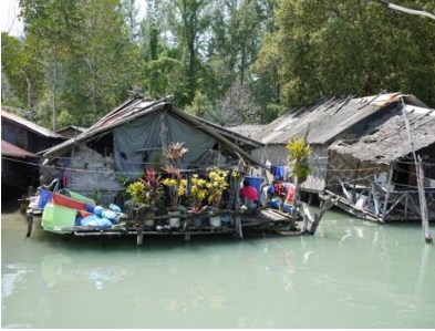
ชุมชนโต๊ะบาหลีบนเกาะลันตา