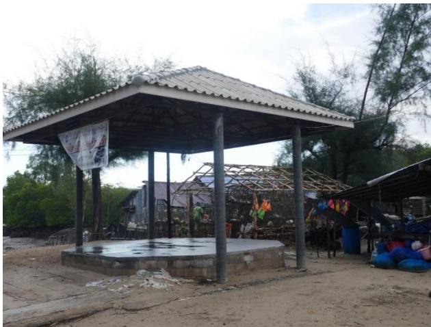
ศาลารูปทรงแปดเหลี่ยมพื้นแปดเหลี่ยม