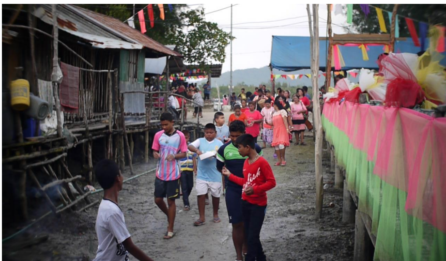
ภาพช่วงงานพิธีลอยเรือที่ชุมชนโต๊ะบุหรัง

ในช่วงพิธีลอยเรือของชาวอุรุกรลาโว้ยชุมชนโต๊ะบาหลิว จะมีญาติพี่น้องจากชุมชนต่างๆ บนเกาะลันตา เช่น คลองดาว ไนไร่ ศาลาด่าน สังกาอู้ และเกาะอื่นๆ เช่น เกาะจำ เกาะพีพี หรือเกาะหลีเป๊ะ จากสตูลมาร่วมพิธีด้วยเป็นจำนวนมากในทุกๆ ปี แม้จะแยกย้ายไปพักตามบ้านหลายๆ หลังก็ยังไม่เพียงพอ เนื่องจากบ้านของชาวเลแต่ละหลังคาเรือนนั้นสร้างไว้สำหรับเพียงพอในการอยู่อาศัยของคนในครอบครัวเท่านั้น เพื่ออำนวยความสะดวกกับญาติพี่น้อง ชาวโต๊ะบาหลิวได้ช่วยกันสร้างเรือนแถวไม้ไว้ประมาณ 4-5 ห้องในบริเวณทางเข้าศาลเจ้าโต๊ะบาหลิวไว้คอยต้อนรับพี่น้องที่มาร่วมพิธี ในปัจจุบัน เรือนแถวหลายหลังปรับเปลี่ยนเป็นบ้านที่มีเจ้าของ เพราะชุมชนมีครัวเรือนขยายเพิ่มขึ้นในพื้นที่ที่จำกัด แต่บ้านเหล่านี้และบ้านอื่นๆ ในชุมชนโต๊ะบาหลิวก็ยังเปิดรับญาติพี่น้องจากเกาะต่างๆ ด้วยความยินดี