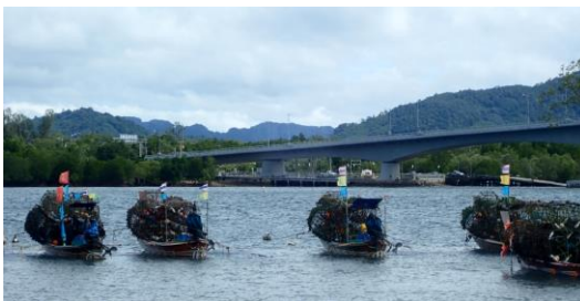
มองจากหมู่บ้านโต๊ะบาหลิวไปจะเห็นสะพานสิริลันตา

ทะเลด้านหน้าหมู่บ้านนั้นต่อเนื่องไปออกทะเลใหญ่ ส่วนด้านตรงกันข้ามก็เป็นเส้นทางไปคลองลัดบ่อแหน ที่มีคลองตามป่าชายเลน ล่องไปได้ถึงพื้นที่บ่อแหนที่เป็นบ้านเดิมของชาวเลได้