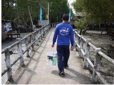
ชาวบ้านเดินไปตามสะพานมุ่งหน้าสู่หมู่บ้าน