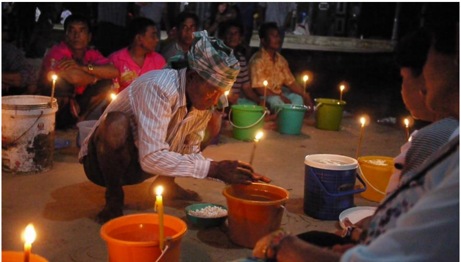
โต๊ะหมอ มะดีเอน ช่างน้ำ ประกอบพิธีทำน้ำมนต์ในช่วงงานพิธีลอยเรือ