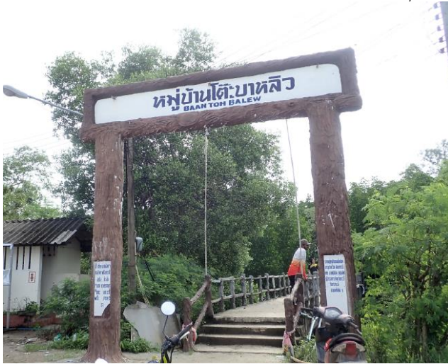
ซุ้มป้ายชื่อหมู่บ้านก่อนเดินไปตามแนวสะพานปูน